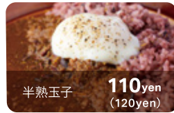
半熟玉子 110yen (120yen)