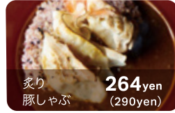
炙り 豚しゃぶ 264yen (290yen)