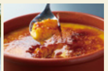
カボチャの プリンブリュレ