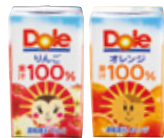
Kids 100%ジュース (りんご / オレンジ) 173yen(190yen)