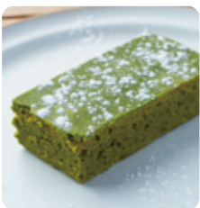
抹茶の ブラウニー 446yen(490yen)