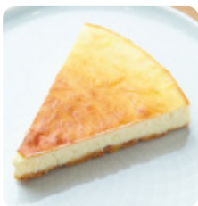
タニタカフェ® バイクドチーズケーキ 537yen(590yen)