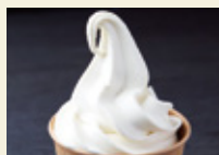
豆乳ソフトクリーム