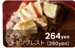
炙り チキンプレスト 264yen (290yen)