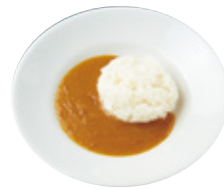
Kids アレルゲンフリーカレー 491yen(540yen)