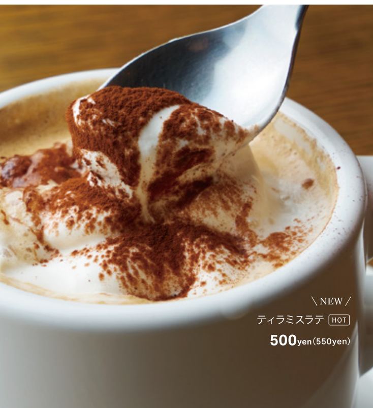
\ NEW / ティラミスラテ HOT 500yen (550yen)