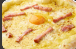
potto 濃厚カルボナーラ ピッツァ