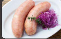
絶品! 瀬戸内レモンソーセージ