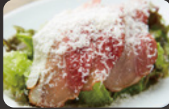
生ハムと グラナ・パダーノチーズサラダ