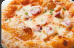
明太子クリームとヤリイカ