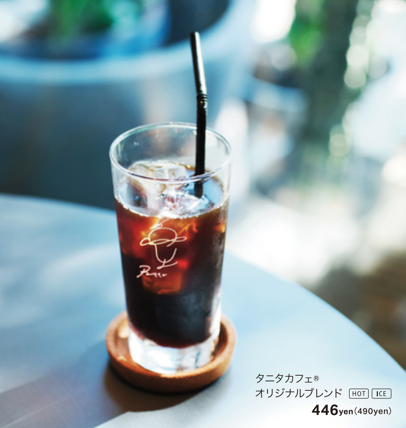
タニタカフェ® オリジナルブレンド HOT ICE 446yen (490yen)