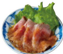
豪州黒牛ローストビーフ すりおろし玉ねぎ醤油ダレ 1,437yen (1,580yen)