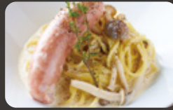
瀬戸内レモンソーセージの クリームパスタ