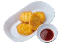
Kids チキンナゲット (BBQソース) 255yen(280yen)