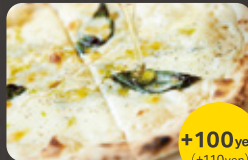
5種のチーズと ハチミツ