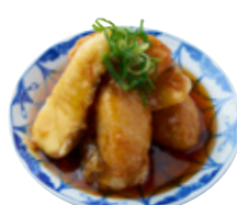
真鯛と蓮根饅頭の 柚子あんかけ 1,491yen (1,640yen)