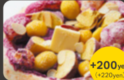
紫芋・サツマイモ・ 栗の塩バターと和三盆