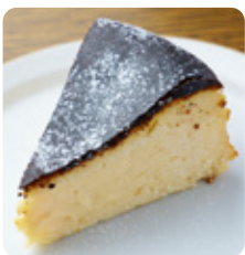
potto “バスク”チーズケーキ 491yen(540yen)