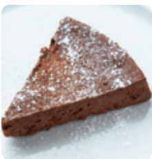
タニタカフェ® ガトーショコラ 537yen(590yen)