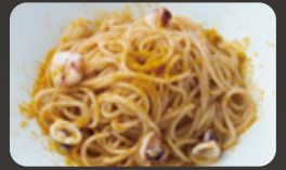
ヤリイカとカラスミの "梅"ペペロンチーノ 追い鰹を添えて