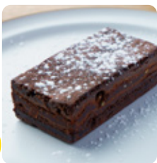
ショコラの ブラウニー 446yen(490yen)