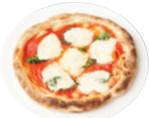
Kids PIZZA マルゲリータ 628yen(690yen)