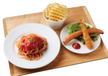
全粒粉 kids“トマトソースパスタ”プレート (ミートソースに変更→+100yen) 810yen(890yen)