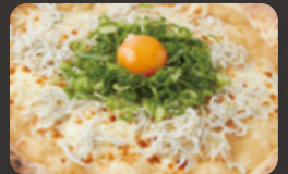
山芋とろろと しらすのピッツァ