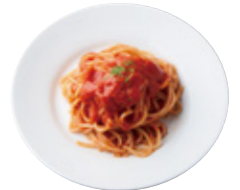
全粒粉 Kids トマトソースパスタ 537yen(590yen)