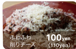
ふわふわ 削りチーズ 100yen (110yen)