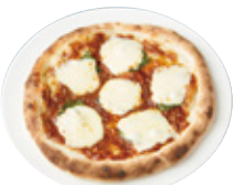
Kids PIZZA ミートソース 628yen(690yen)