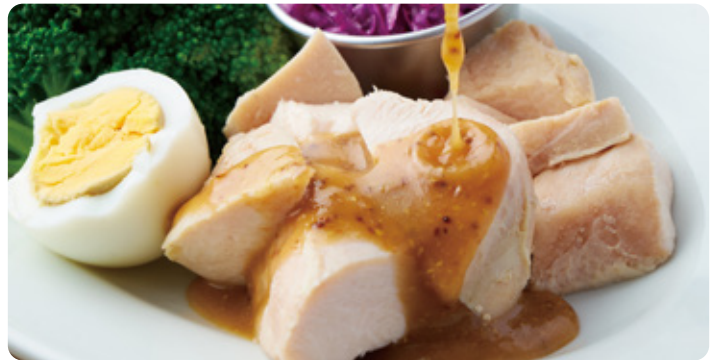
ブロッコリー&備中高原チキンプレストプレート