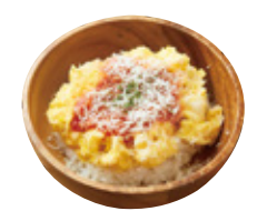
Kids まぜまぜオムライス 537yen(590yen)