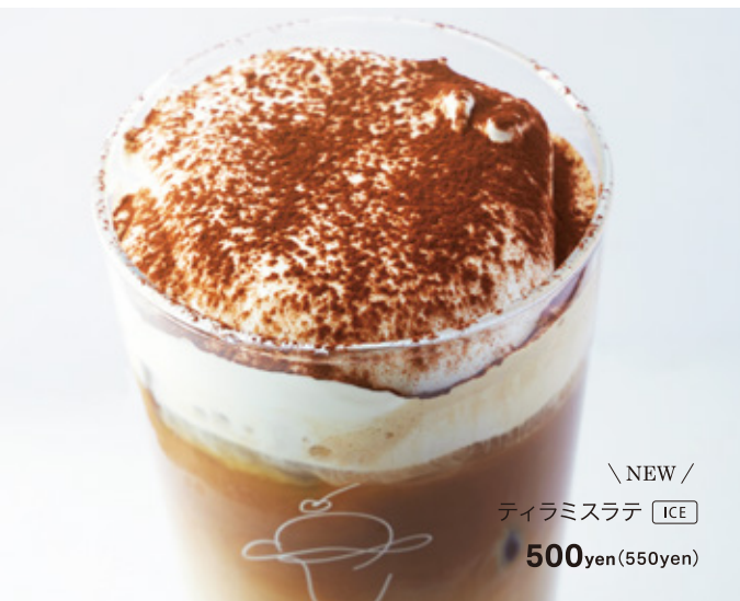
\ NEW / ティラミスラテ ICE 500yen (550yen)