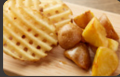
フライドポテト ブラザーズ