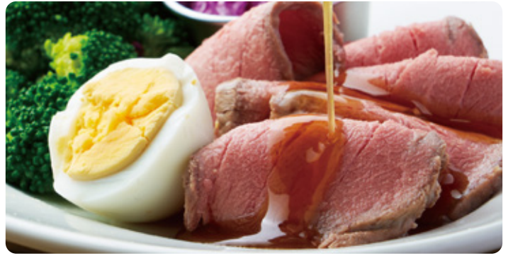
ブロッコリー&豪州黒牛ローストビーフプレート