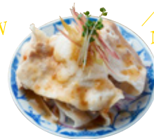
冷豚しゃぶの大根粗おろし 紀州の梅ダレ 1,437yen (1,580yen)