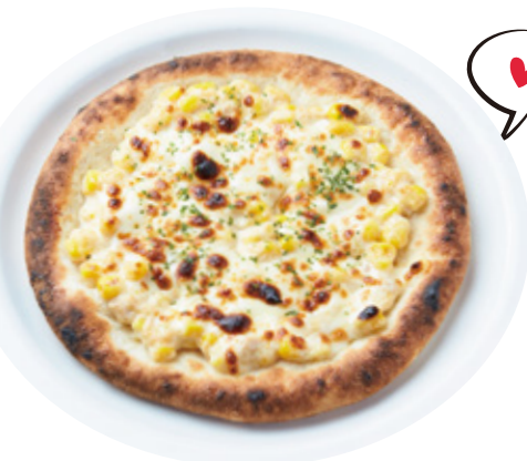
Kids PIZZA マヨコーン 628yen(690yen)