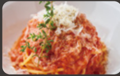
完熟トマトと バターとチーズ