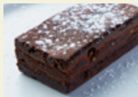
ショコラのブラウニー