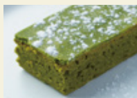
抹茶のブラウニー