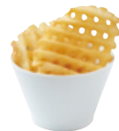
Kids ラテスカットポテト 255yen(280yen)