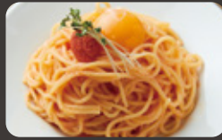
あご出汁の博多明太子 釜玉和風ソース