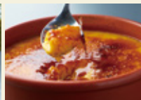
カボチャの プリンブリュレ