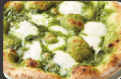
バジルのピッツァ