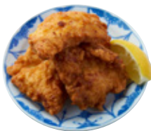
あご出汁と塩麹 備中高原鶏のから揚げ 1,355yen (1,490yen)