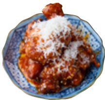
備中高原鶏の旨辛ヤンニョムチキンと ふわふわチーズ 特製韓国発酵味噌ダレ 1,355yen (1,490yen)