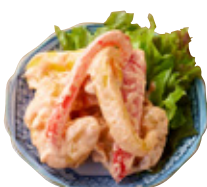
ぷりぷり海老の 博多明太子マヨネーズ 1,491yen (1,640yen)