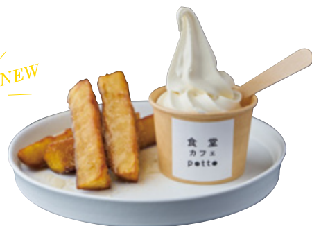
さつまいものフライドポテトと はちみつときな粉 719yen(790yen)