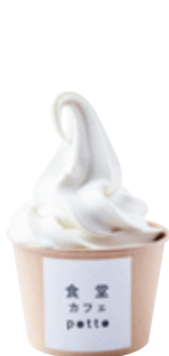
タニタカフェ® 豆乳ソフトクリーム 319yen(350yen)