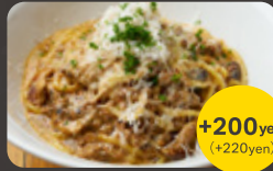
ボルチーニ香る 濃厚クリーム potto ミートソース