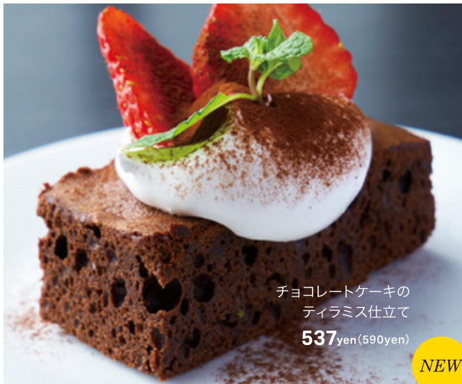
チョコレートケーキの ティラミス仕立て 537yen(590yen)

食後に、カフェタイムに、特製スイーツをどうぞ。 ソフトクリーム各種はテイクアウトも可能です。