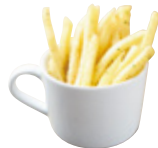
Kids クリスピーポテト 219yen(240yen)