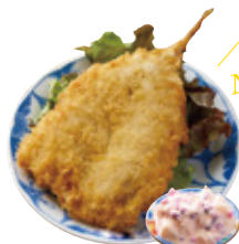
鳥取県境港産アジフライ 柴漬けタルタル 1,355yen (1,490yen)