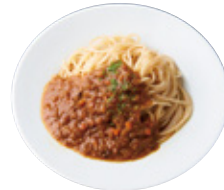
全粒粉 Kids ミートソースパスタ 628yen(690yen)