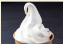
豆乳ソフトクリーム