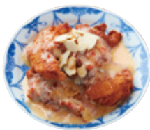
備中高原鶏の スイートチリマヨチキン 焦がしアーモンド 1,355yen (1,490yen)