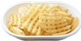
厚切り ラテスカットポテト 590yen