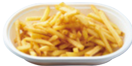
クリスピー フライドポテト 490yen