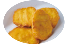
kids チキンナゲット 390yen