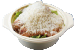
生ハムとグラナダ チーズのサラダ 650yen