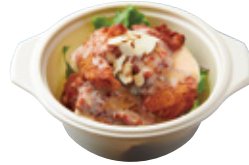
備中高原鶏の スイートチリ マヨチキン 650yen