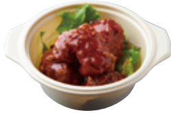
備中高原鶏の ヤンニョムチキン 620yen