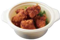
備中高原鶏の あご出汁と塩麹 唐揚げ 520yen