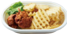
ポテカラ 厚切り ラテスカットポテト 770yen