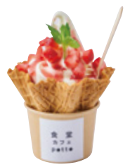
つぶつぶ苺と ストロベリーソース 595yen