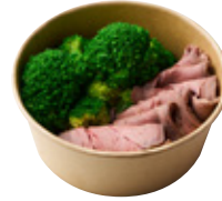
低糖質! 低脂肪! 高たんぱく! フロココリー& 蒙州黒牛ローストビーフ(各100g) 930yen