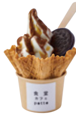
ザクザクオレオと チョコレート 595yen