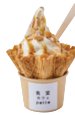
キャラメルソースと ローストアーモンド 595yen