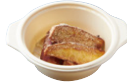
サツマイモの フライドポテト 540yen