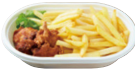
ポテカラ クリスピーポテト 670yen