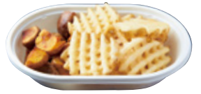
フライドポテト ブラザーズ 690yen