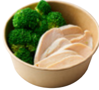
低糖質! 低脂肪! 高たんぱく! フロココリー& 備中高原鶏むね肉(各150g) 650yen