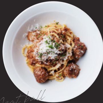
豪州黒牛100%ミートボールミートソース