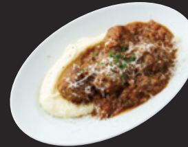
豪州黒牛100%ミートボール