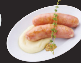
瀬戸内レモンソーセージマッシュポテトと粒マスタード