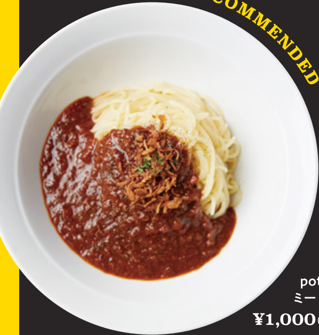
potto定番 ミートソース