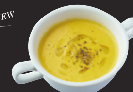
南瓜とさつまいものポタージュ