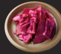
紫キャベツのバリバリピクルス