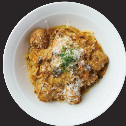
ポルチーニ香る濃厚クリームミートソース × 豪州黒牛100%ミートボール