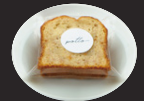
季節のホームメイドパウンドケーキ