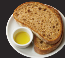
石窯シリアルブレッド