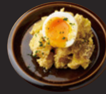
トロ玉アンチョビポテサラ