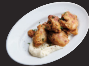
備中高原鶏のタンドリーチキン