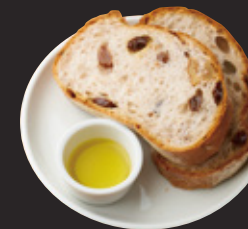
石窯胡桃レーズンブレッド