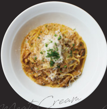
ポルチーニ香る濃厚クリームミートソース