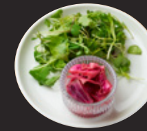
マイクログリーンと水菜とピクルスサラダ