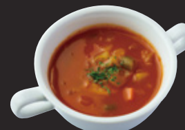
十二の野菜とアサリのミネストローネ