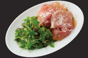
欧州産生ハムとグラナダチーズのサラダ