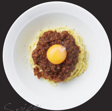
自家挽き SPICE ミートソース