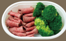
低糖質！低脂肪！高たんぱく！ ブロッコリー& 豪州黒牛ローストビーフ(各100g) 930 YEN