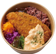
サーモンフライ BENTO 890 YEN ～明太子タルタル～