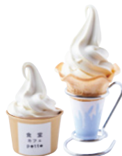
豆乳ソフトクリーム (カップ or コーン) 350 YEN