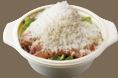
生ハムとグラナダ チーズのサラダ 650 YEN