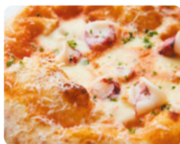
明太子クリームと ヤリイカ 1,440 YEN