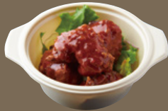
備中高原鶏の ヤンニョムチキン 620 YEN