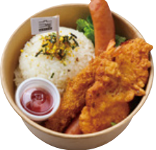
お子様BENTO 790 YEN