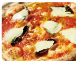
マルゲリータ 1,240 YEN