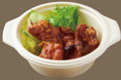
備中高原鶏の 柚子胡椒ポン酢タレ 唐揚げ 620 YEN