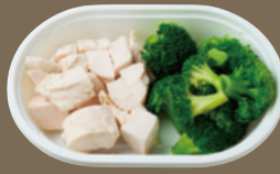
低糖質！低脂肪！高たんぱく！ ブロッコリー& 備中高原鶏むね肉(各150g) 650 YEN