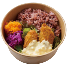
岡山県産 牡蠣フライ BENTO～瀬戸内レモンタルタル～ 890 YEN