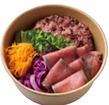
豪州黒牛 ローストビーフ BENTO 940 YEN 【さっぱりタレorこってりタレ】