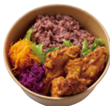
備中高原鶏の あご出汁と塩麴の 唐揚げBENTO 790 YEN