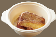
サツマイモの フライドポテト ～ハチミツきなこ～ 540 YEN