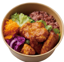
備中高原鶏の 柚子胡椒ポン酢タレの 唐揚げBENTO 890 YEN