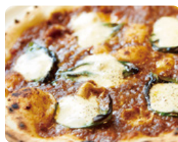
pottoオリジナル ミートソース 1,340 YEN