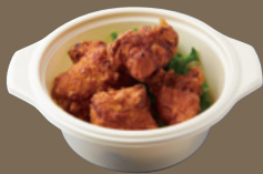
備中高原鶏の あご出汁と塩麴 唐揚げ 520 YEN