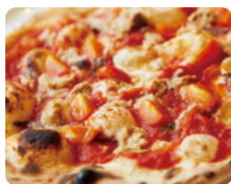
ロマーナ 1,240 YEN