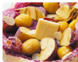
紫芋・サツマイモ・ 粟の塩バター 1,640 YEN