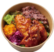
備中高原鶏の ヤンニョムチキン BENTO 890 YEN