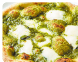
バジルのピッツァ 1,440 YEN