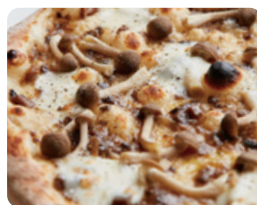
木ノ子のピッツァ 1,640 YEN