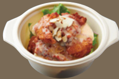
備中高原鶏の スイートチリ マヨチキン 620 YEN