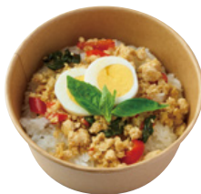
エスニックガバオ ライスBENTO 890 YEN