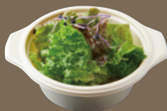
グリーンサラダ 450 YEN