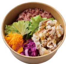
豚しゃぶの やみつきたれ BENTO 890 YEN