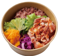
豚しゃぶの コリアンタレ BENTO 890 YEN