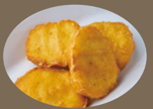
kids チキンナゲット 390 YEN 【ケチャップorバーベキューソース】